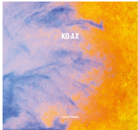
Album „Loose Frames“ (2017, Freifeld Tonträger)