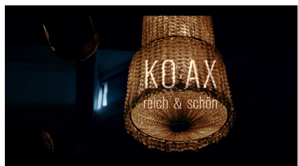
Live Recording Sessions aus dem Treibhaus Innsbruck (2022)