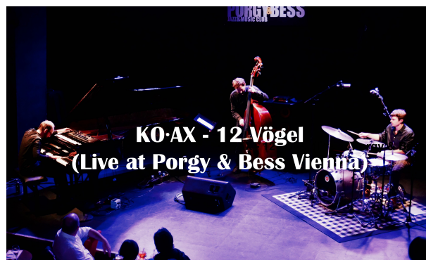
Konzertmitschnitt aus dem Porgy & Bess (2023)